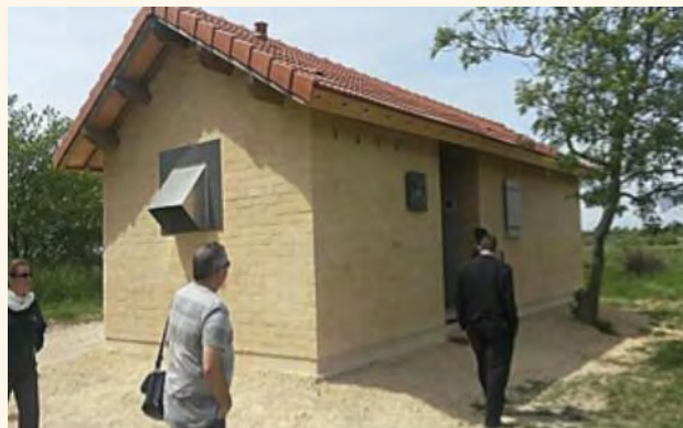
Maison des chauve-souris © D. Bienaimé.