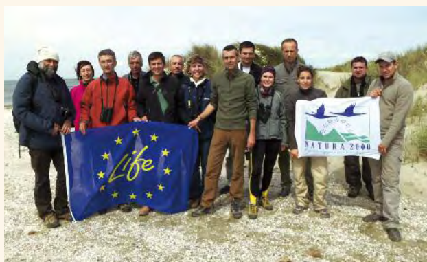
Les partenaires techniques du LIFE SALT sur la zone de protection de la pointe de Beauduc.

Les rencontres du programme LIFE SALT se sont déroulées en Camargue du 19 au 21 mai dernier en présence de l'ensemble des partenaires techniques et financiers. Ce programme d'action vise à renforcer l'intérêt biologique des salins en activité ou en déprise en Méditerranée. A cette occasion, les partenaires italiens et bulgares accompagnés du bureau externe de la Commission européenne ont pu visiter le site des étangs et marais des salins de Camargue et découvrir les aménagements en cours ou à venir d'ici la fin du programme. Les prochains ateliers techniques se dérouleront dans le delta du Pô en Italie à la fin 2015.