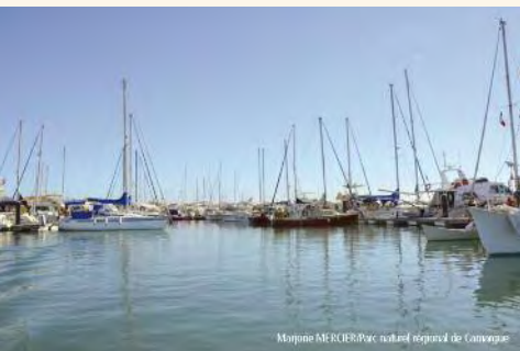
Martigues ARBORE Parc naturel régional de Camargue