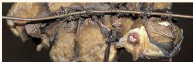
Grand rhinolophe

comprend aisément qu'il pénètre dans une véritable « maison à chauves-souris ». Il perçoit ainsi l'importance de la présence de bâtiments construits par l'homme pour la conservation des espèces visées. Les différents thèmes importants, tels les chauves-souris et le pastoralisme ou les haies, sont repris sous forme de bornes interactives.